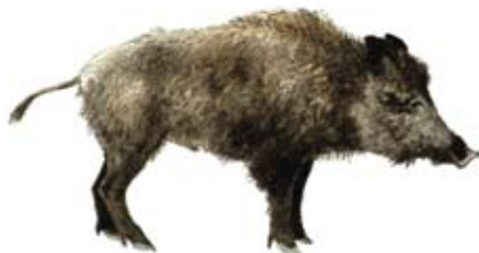
ILLUSTRATION R. SVENSSON

Som enskild trafikant kan du själv minska risken för kollision med vildsvin och andra viltslag och öka marginalerna mot allvarliga skador. Vi råder dig därför att vidta följande tre