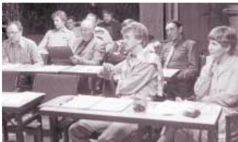
Halvårsmöte i Bollnäs 1982.